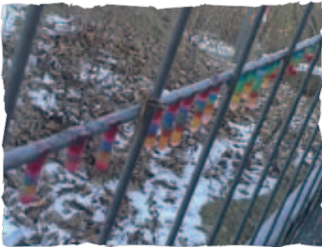
Die 4. Klasse hatte im Winter in der sehr kalten Zeit eine richtig gute Idee: mit gefärbtem Wasser (mit Aquarellfarben) Eiszapfen „herstellen“. Die Kunstwerke hingen am Bauzaun direkt vor dem Kucheneingang.

Keiner hat es mehr geglaubt, aber am Faschingsdienstag, am 21. Februar, hatte es über Nacht plötzlich sehr geschneit! Ein paar Kinder aus der 6. Klasse bauten daher diesen tollen Schneemann.